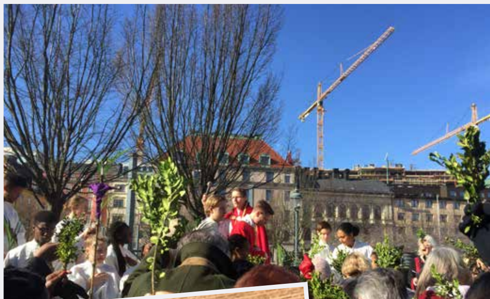
Palmsöndagens firande börjar med palmvigning och procession in i kyrkan. I år sken solen över Kungsträdgården.