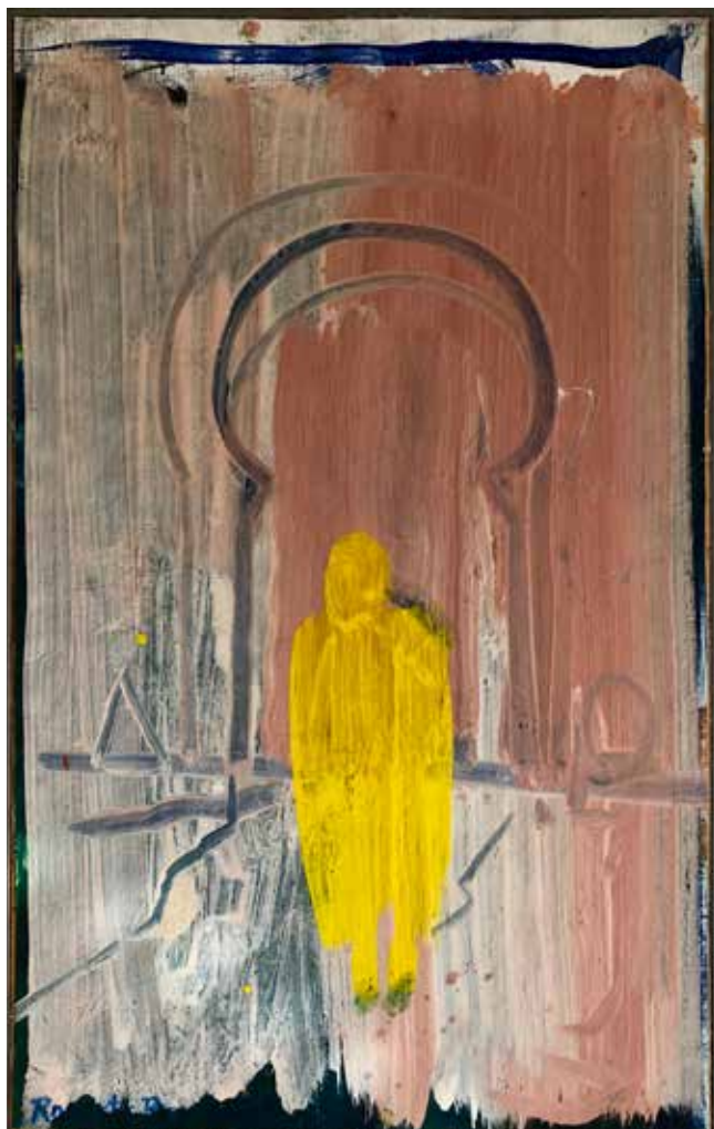
Portal , målning av Rogerts Bondesson.

MITT I YRAN av förrättningar, Bilda-listor, ärliga möten, dörrar i församlingen som ska låsas upp (man önskar ibland att man inte hade nycklarna!), trixet med äktenskapsblanketter, vänliga ord och godhet, åsikter om smått och stort, trosuppfattningar som går i alla riktningar och allt annat som en församling erbjuder så stannar jag upp inför en målning på mitt rum. Målningen heter Portal . En gestalt går igenom ett dimmigt valv målat mot en blekrosa fond. Tempera på duk. Jag köpte målningen för längesedan av en lärare på min konstskola. Den har varit med sedan resans början.