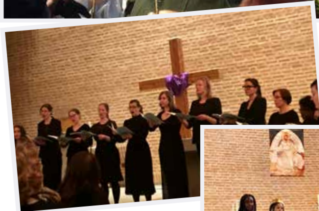
Körerna har sjungit flitigt under våren. Ovan ses Vokalensemblens och Ungdomskörens sopraner/altår framföra Stabat Mater av Pergolesi. T.h. och nästa sida ses Barnkören i musikalen Daniel .