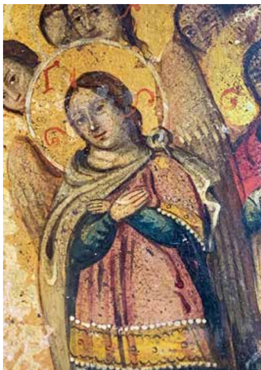
Angel from a russian ikon from the 1700/1800s.

Mass in English. Sundays at 6 pm. For the daily Mass schedule in Swedish, please see p 2.