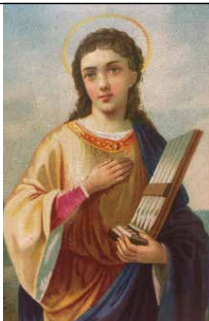
S:ta Cecilia, musikens skyddshelgon, ur en fransk helgonkalender från 1800-talet.

31/5 🎵 Pingstdagen: Orgelkonsert. Ulf Samuelsson. Kl 13.