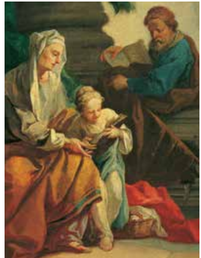
Maria undervisas av föräldrarna Anna och Joakim. Målning av Daniel Gran, 1700-talet.

* Ring expeditionen för mer info om detta.