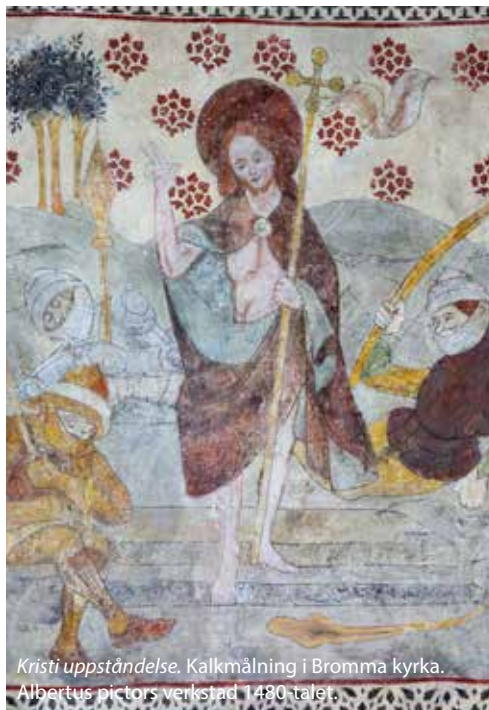
Kristi uppståndelse. Kalkmålning i Bromma kyrka. Albertus pictors verkstad 1480-talet.

* Processionen som inleder Palmsöndagens liturgi utgår kl 11 från Kungsträdgården, mittemot kyrkan. Palmkvistar finns att köpa vid kyrkans entré.