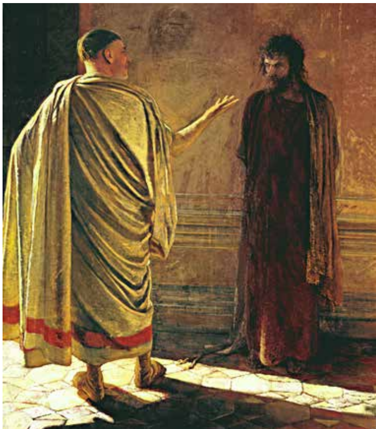
Kristus och Pilatus. Målning av Nikolaj Ge 1890.

Och vad kan man svara på en sådan fråga? Kan en människa icke genom att stå och tala med mig bli viss om att jag faktiskt finns, så kan min försäkran inte hjälpa. Denna min försäkran är ju långt ringare än min tillvaro. Så förhåller det sig också med Kristus inför Pilatus. Kristus är sanningen. Kan hans liv, hans person inte öppna Pilatus ögon för vad som är sanning, så är det omöjligt att genom språklig förmedling försöka övertyga honom.