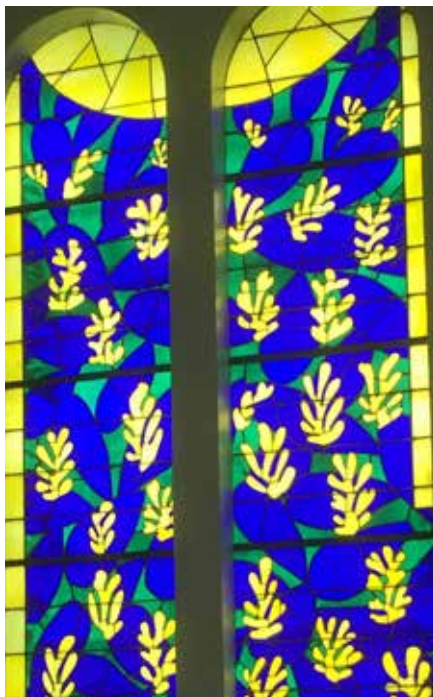
Glasmålning av Henri Matisse 1951. Chapelle du Rosaire, Vence, Frankrike.

Men det finns en sorts tro som aldrig kan ersättas av vetande. Även om det är lite klichéartat, låt mig utgå från en kärleksförklaring. Vad innebär det om någon säger: Jag älskar dig? Först uppstår frågan: Varför säger han det? Han kan uppge alla möjliga orsaker som drar honom till henne. Men även om han räknade upp allting han kan