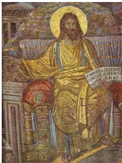
Kristus. Mosaik i kyrkan Santa Prudenziana, Rom. 400-talet.