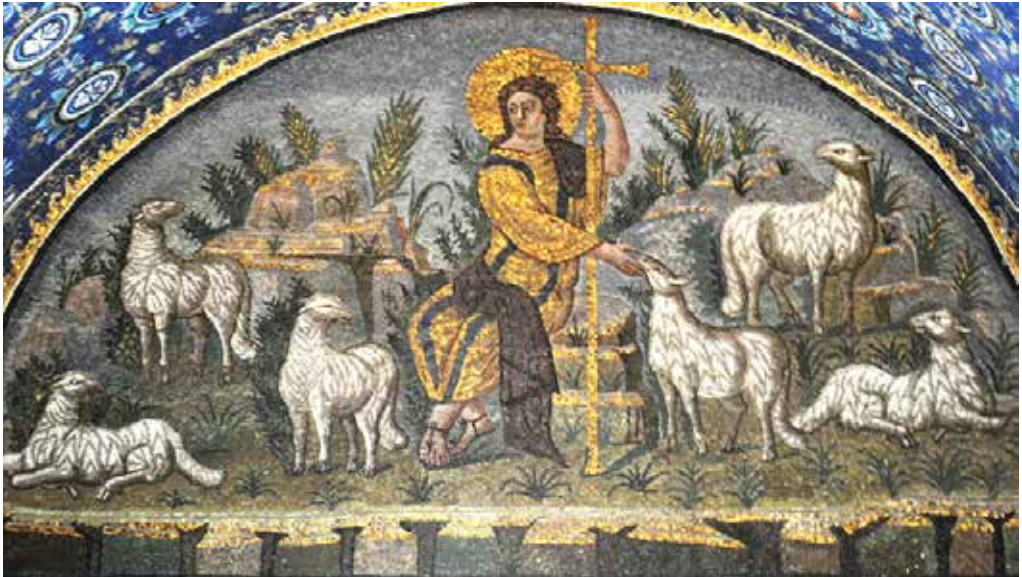
Den gode Herden. Mosaik i Galla Placidias mausoleum, Ravenna. 400-talet.

27/6 – torsdag: 40 timmars eukaristisk tillbedjan börjar efter kvällsmässan kl 18. Completorium kl 20.40.