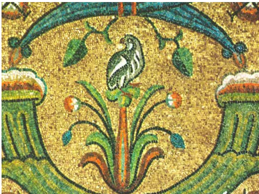
Mosaik i kyrkan San Vitale , Ravenna. 500-talet.

ATT I TYSTHET VÖRDA GUD. Människan måste komma i stillhet inför Gud och bli tyst för att höra och bli berörd. Därute hos fågeln och liljan råder tystnaden. Men vad uttrycker denna tystnad? Den uttrycker vördnad inför Gud. Att det är Gud som råder och att det är han som är den ende som kan tillskrivas vishet och förstånd. Just därför är denna tystnad för Gud vördnadsbjudande, en i naturen respektfull tystnad. Det är en tillbedjande tystnad och det är därför en högtidlig tystnad. Och det är för att denna tystnad är så högtidlig som man förnimmer Gud i naturen. Underligt är det väl då inte att allt tiger i vördnad och respekt för Honom – även om Han inte talar. Att allt tiger i vördnad för Honom inverkar på var och en som om Han talade – en talande tystnad.